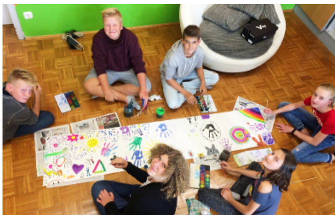
Die SchülerInnen der vierten Klasse hatten viele kreative Ideen, wie sie Vielfalt und Inklusion künstlerisch darstellen.

Die dritten und vierten Klassen der NMS Gutau starteten das neue Schuljahr gleich mit einem dreitägigen Projekt, welches vom Zivilinvalidenverband OÖ initiiert und von der youngCaritas mit den SchülerInnen umgesetzt wurde.