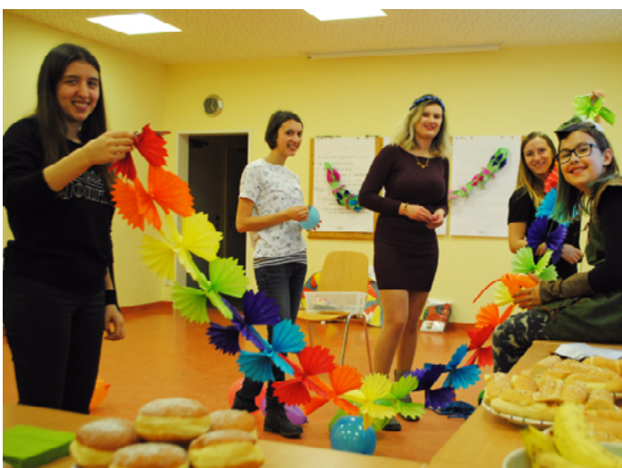
Die actionPoolerInnen bereiteten das Fest vor.

„Jetzt wird der Fasching mal so richtig gefeiert!“ Nach diesem Motto verbrachten unsere actionPoolerInnen einen Nachmittag lang im Haus für Mutter und Kind in Linz. Superman, Cinderella und Batman erschienen zur Feier und die Kinder wurden gleich mal geschminkt. Aus Luftballons wurden Tiere geformt. Das größte Highlight war aber eine Raketenstation, wo die Kinder ihre gebastelten Raketen durch den Raum pusten durften.