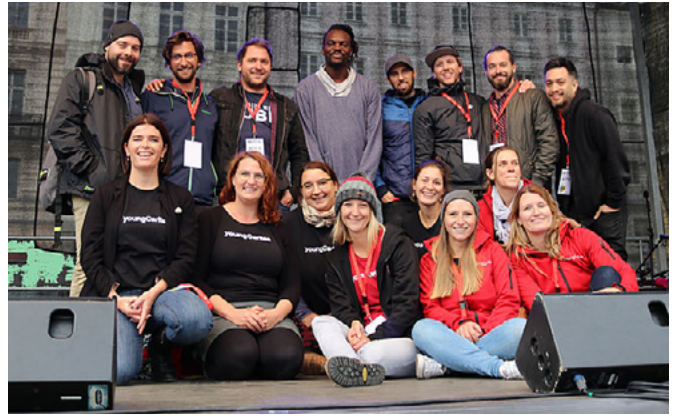
Das youngCaritas-Team mit „Scheibsta und die Buben“ und „Hinterland“.

Anlässlich unseres 20-jährigen Bestehens feierten wir unseren Geburtstag mit ca. 180 BesucherInnen bei einem Mini-Festival am Linzer Hauptplatz. Ordentlich eingeeizt haben „Scheibsta und die Buben“, „Hinterland“ und „Jahna“. Für kulinarischen Genuss sorgte der Speisewagen der Caritas sowie ein Buffet. Um auch für die Jüngsten unter uns ein attraktives Angebot zu bieten, konnten diese durch den Spielplatz der Vielfalt wandern und bei sechs Stationen bewährte youngCaritas-Methoden kennenlernen.