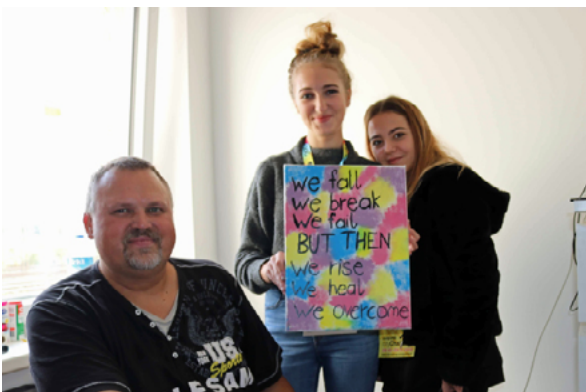
cityChallenge der Fachschule Oblatinnen in Linz

Die 264 teilnehmenden SchülerInnen setzten sich mit dem Thema „Armut in Österreich“ auseinander, meisterten die ihnen gestellten „challenges“ bravourös und wurden am Ende des Tages zu „openMinderInnen“ gekürt.