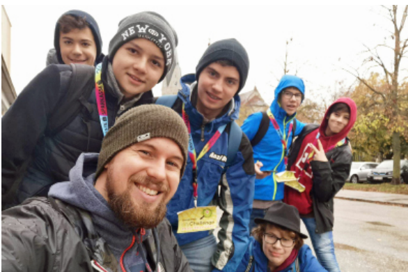
cityChallenge des BRG Franziskanerinnen Wels