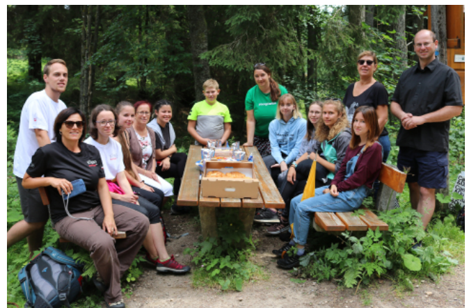
Das Abschluss-Picknick am Schwemmkanal

Zum Abschluss veranstalteten wir ein Picknick an der Grenze, das an das Paneuropäische Picknick vom 19. August 1989 erinnern sollte. Es war ein sehr intensiver und schöner Austausch und bleibt sicherlich allen 11 TeilnehmerInnen noch lange in Erinnerung.