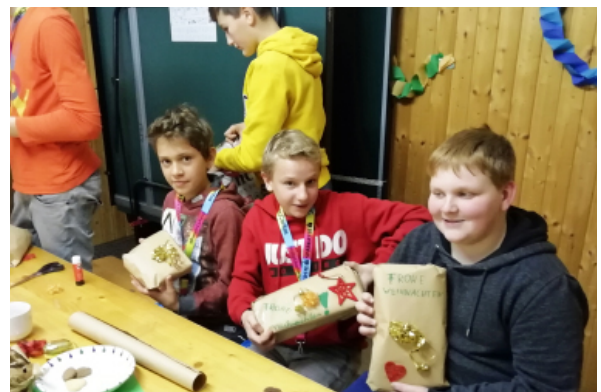
cityChallenge der NMS Scharnstein