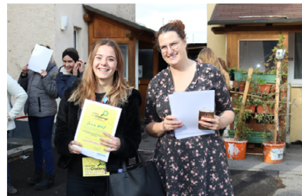
Übergabe der Urkunden für die openMinderInnen

6 Schulen mit insgesamt 264 SchülerInnen haben bei der Premiere der „cityChallenge“ mitgemacht und sich als openMinderInnen qualifiziert. Das waren wundervolle und ereignisreiche Tage!